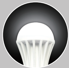
MO-B2601-WH 昼白色 (色温度: 5000K)