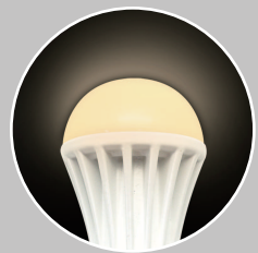
MO-B2601-YL 電球色 (色温度: 2700K)